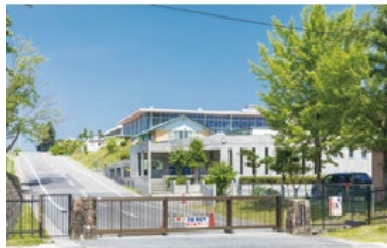
可児市立広見小学校 徒歩27分（約2,100m）