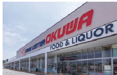
オークワ可児御嵩インター店 徒歩5分（約350m）