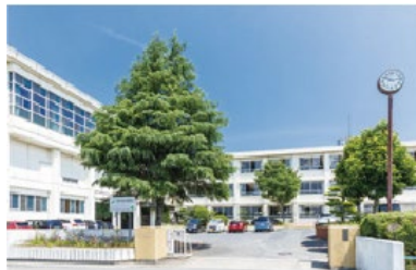
可児市立中部中学校 徒歩33分（約2,600m）